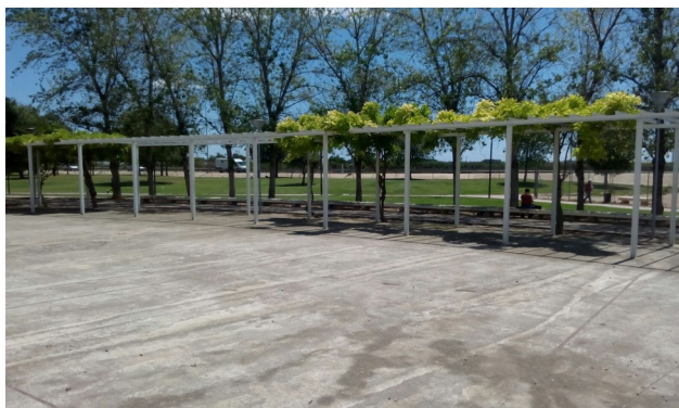
Espai de l'albereda, front a l'institut Clara Campoamor, on instal·lar taulers de bàsquet.