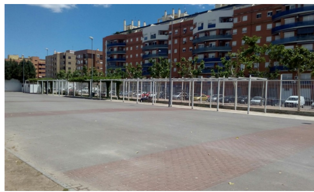
Parc de la Sequieta, zona asfaltada, on instal·lar taulers de bàsquet.