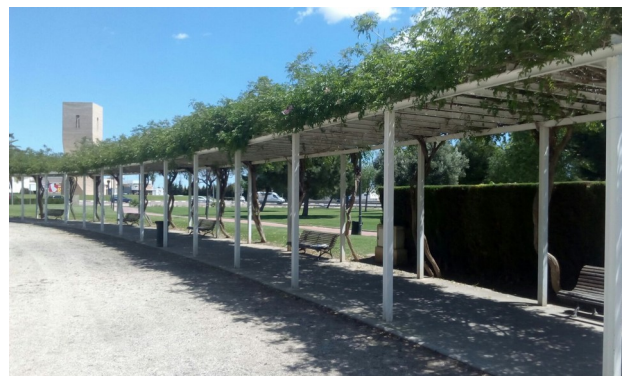
Final de l'albereda, front la quarta torre, on instal·lar taulers de bàsquet.