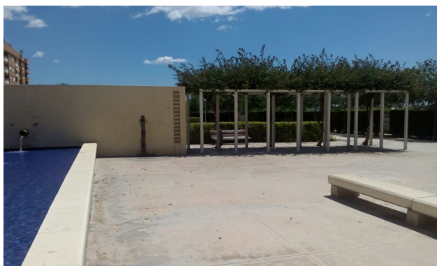
Final de l'albereda, front a l'entrada dels horts urbans, on instal·lar taulers de bàsquet.